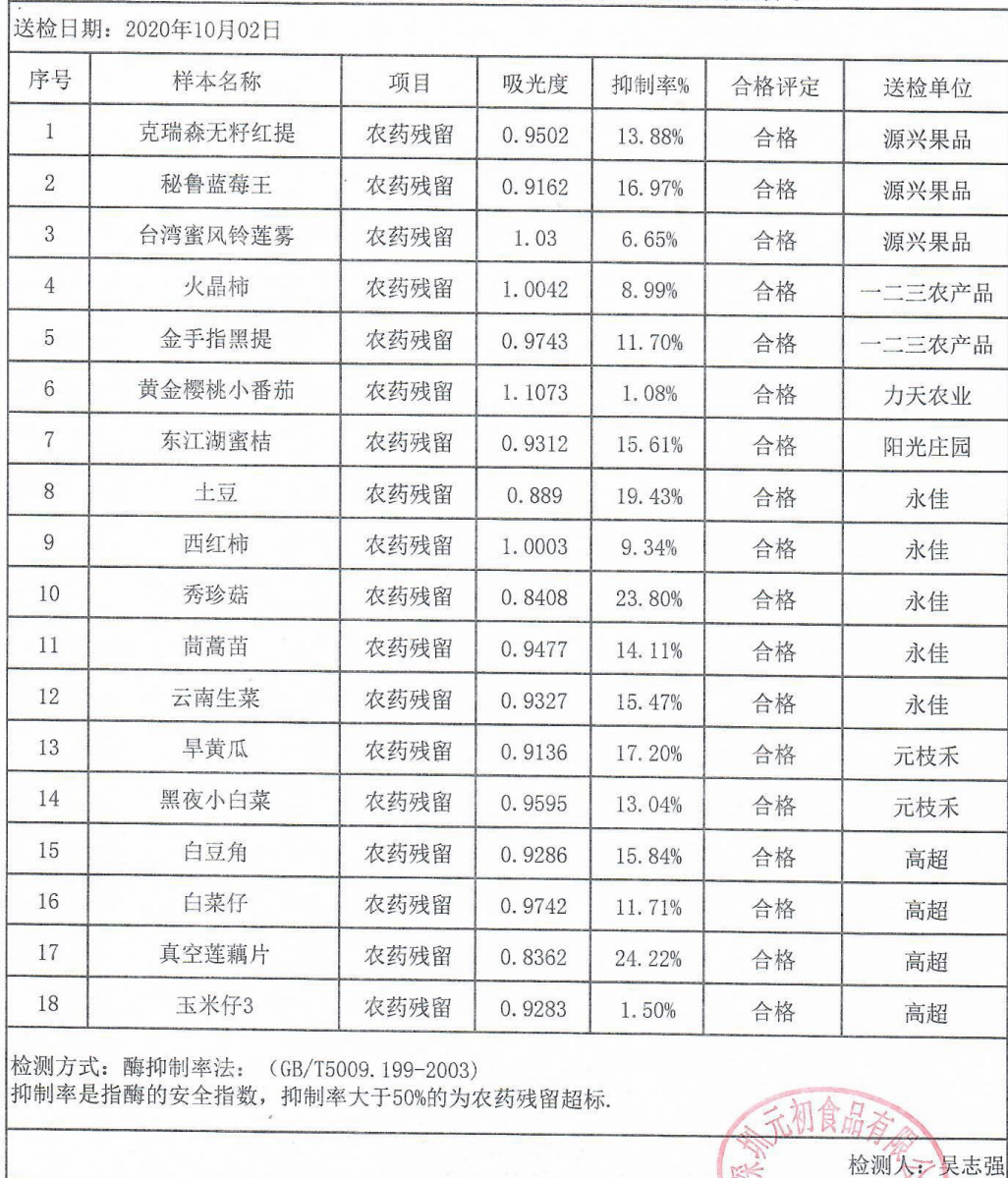
深圳元初水果蔬菜农药残留测量数据表